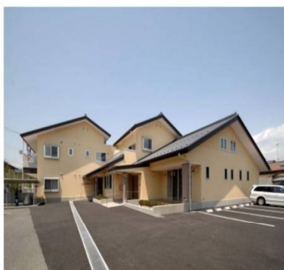
シニアたかだハウス