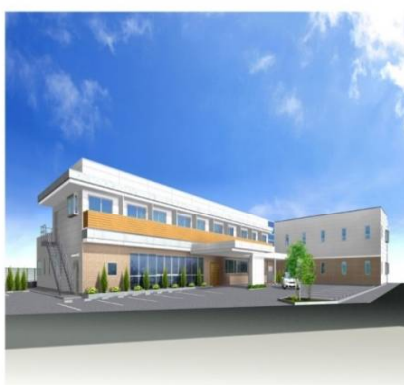
シニア丹波島ハウス