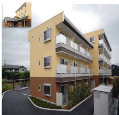
シニア南俣ハウス