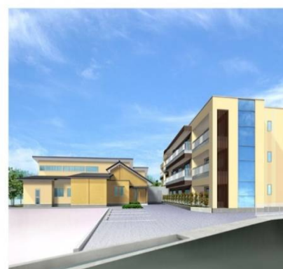
シニア若里ハウス