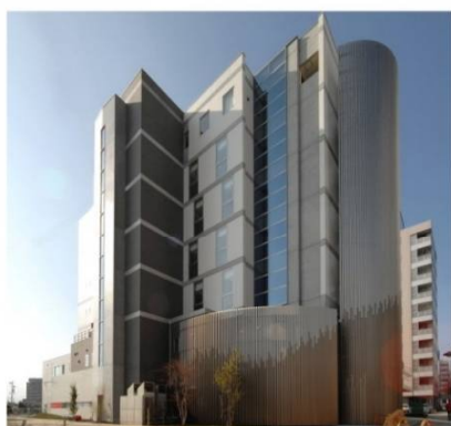
シニア東口ハウス