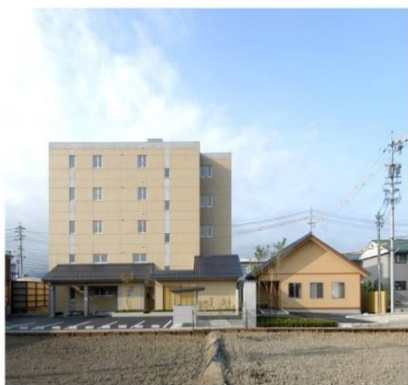
シニアいなばハウス